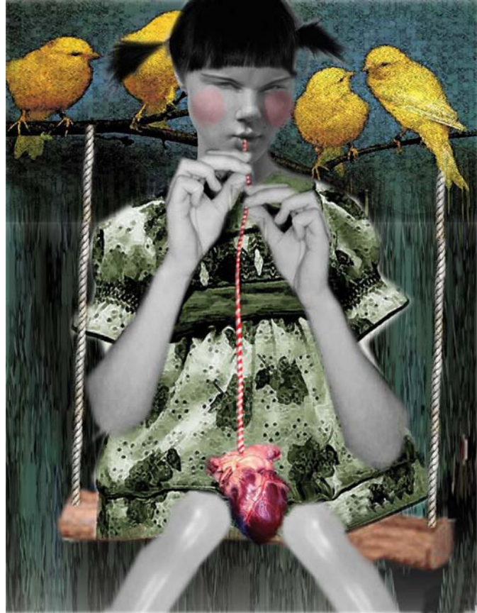
Vitamina C ilustración digital. 2009