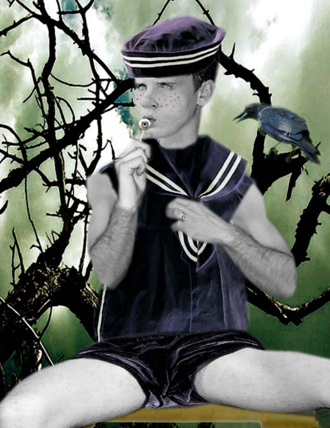
Bolón de ojo ilustración digital. 2009