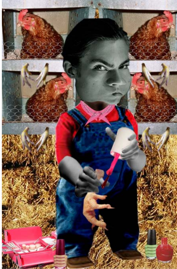
Chicken cuté ilustración digital. 2009