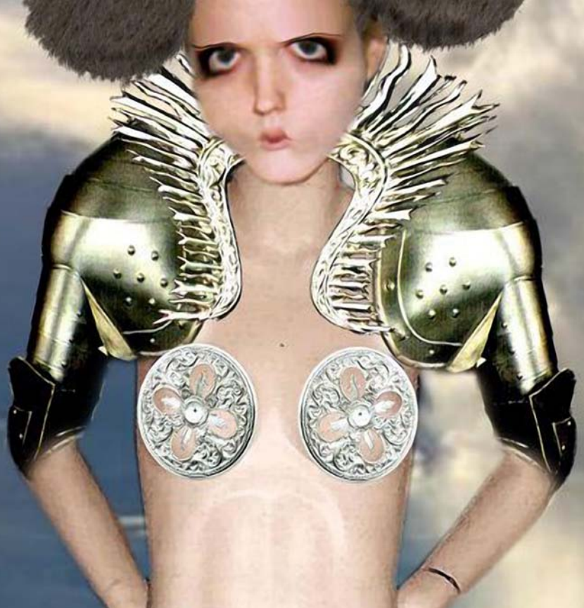
Ama de llaves ilustración digital. 2009

Desde pequeño, siempre me gustó dibujar. De adolescente, descubrí el mundo del arte y el diseño, y así los años 80 vieron (al igual que las páginas de mis libros del colegio) como mi pasión se convertía en una vocación. Me matriculé en la carrera de Publicidad, y luego de trabajar en el medio publicitario por un tiempo, me fui a La Escuela de Diseño de Altos de Chavón donde obtuve un grado asociado en diseño de moda.