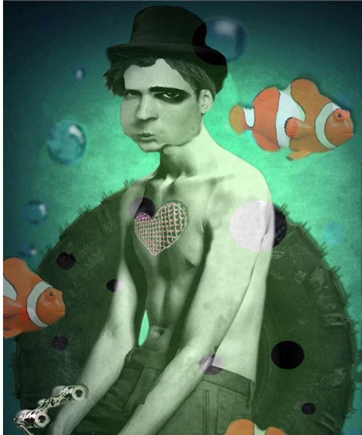
Ópera y naufragio ilustración digital. 2009