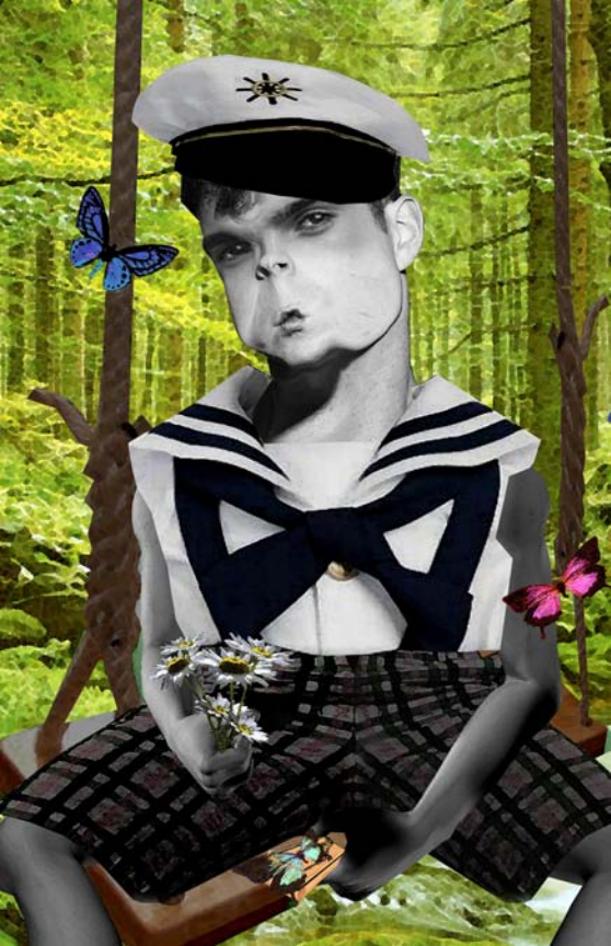
Cazador de mariposas ilustración digital. 2009