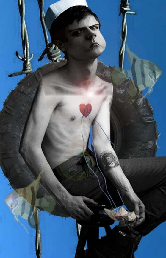
A la deriva ilustración digital. 2009