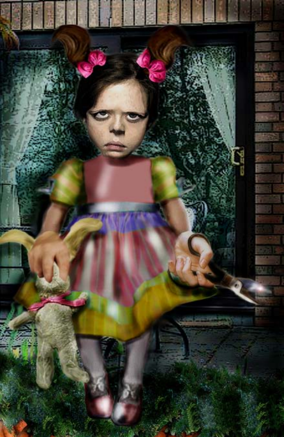
Crimen y castigo ilustración digital. 2009